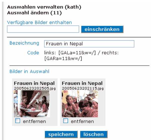
Abb. 7: Formular «Auswahl ändern» (Bilder entfernen)

Wenn eine Auswahl bereits Bilder enthält, können Sie diese natürlich auch wieder entfernen. Zu diesem Zweck werden unter der Feldbezeichnung «Bilder in Auswahl» als Vorschau alle Bilder gezeigt, die bereits zur Auswahl gehören. Beim nächsten Speichern der Auswahl werden alle Bilder aus der Auswahl entfernt, deren Check-box neben «entfernen» markiert ist. Dabei wird nur die Zugehörigkeit zu dieser Auswahl gestrichen. Die Bilddaten, die Bilder selbst und Verknüpfungen mit andern Auswahlen oder Themen werden dadurch nicht tangiert.