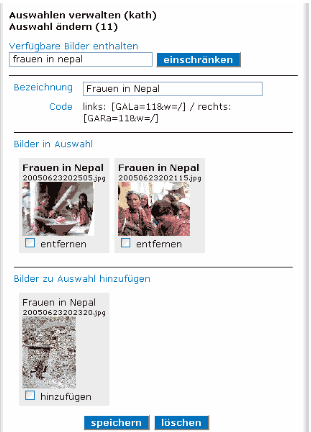
Abb. 8: Formular «Auswahl ändern» (Bilder entfernen und hinzufügen)

einzigem Schritt unliebsame Bilder aus der Auswahl entfernen und neue Bilder hinzufügen. Das Markieren der Checkboxes bei «entfernen» oder «hinzufügen» hat erst einen Einfluss auf die Auswahl, wenn Sie die Befehlsschaltfläche «speichern» anklicken.